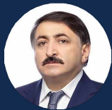
ГАСАНОВ ДЖАМАЛАДИН НАБИЕВИЧ

Депутат Государственной Думы ФС РФ, Председатель комитета Государственной Думы ФС РФ по труду, социальной политике и делам ветеранов