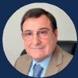
СТРАШКО ВЛАДИМИР ПЕТРОВИЧ

Председатель правления акционерного общества «Росгеология»