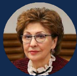
КАРЕЛОВА ГАЛИНА НИКОЛАЕВНА

Первый заместитель министра экономического развития РФ