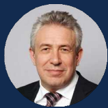
ГОРЬКОВ СЕРГЕЙ НИКОЛАЕВИЧ

Депутат Государственной Думы ФС РФ, к.ф.н.