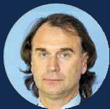
ЛИСОВСКИЙ СЕРГЕЙ ФЁДОРОВИЧ

Депутат Государственной Думы ФС РФ, к.п.н., Член Комитета Государственной Думы по безопасности и противодействию коррупции