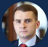
НИЛОВ ЯРОСЛАВ ЕВГЕНЬЕВИЧ

Депутат Государственной Думы ФС РФ, первый заместитель председателя Комитета Государственной Думы по охране здоровья, заслуженный врач РФ, д.м.н., профессор