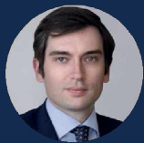
КОЛЕСНИКОВ МАКСИМ АНДРЕЕВИЧ

Первый заместитель министра экономического развития РФ