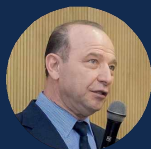
КВИНТ ВЛАДИМИР ЛЬВОВИЧ

Академик РАН, д.э.н., Лауреат высшей награды МГУ, член Президиума Международного Союза экономистов