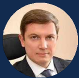
МАТЮШИН КИРИЛЛ РУСЛАНОВИЧ

Генеральный директор ПАО «ЦМТ» экс-вице-президент ТПП РФ, экс-заместитель министра экономического развития и торговли РФ