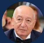
РЕНОВ ЭДУАРД НИКОЛАЕВИЧ

Депутат Государственной Думы ФС РФ, Заместитель Председателя Комитета Государственной Думы по науке и высшему образованию