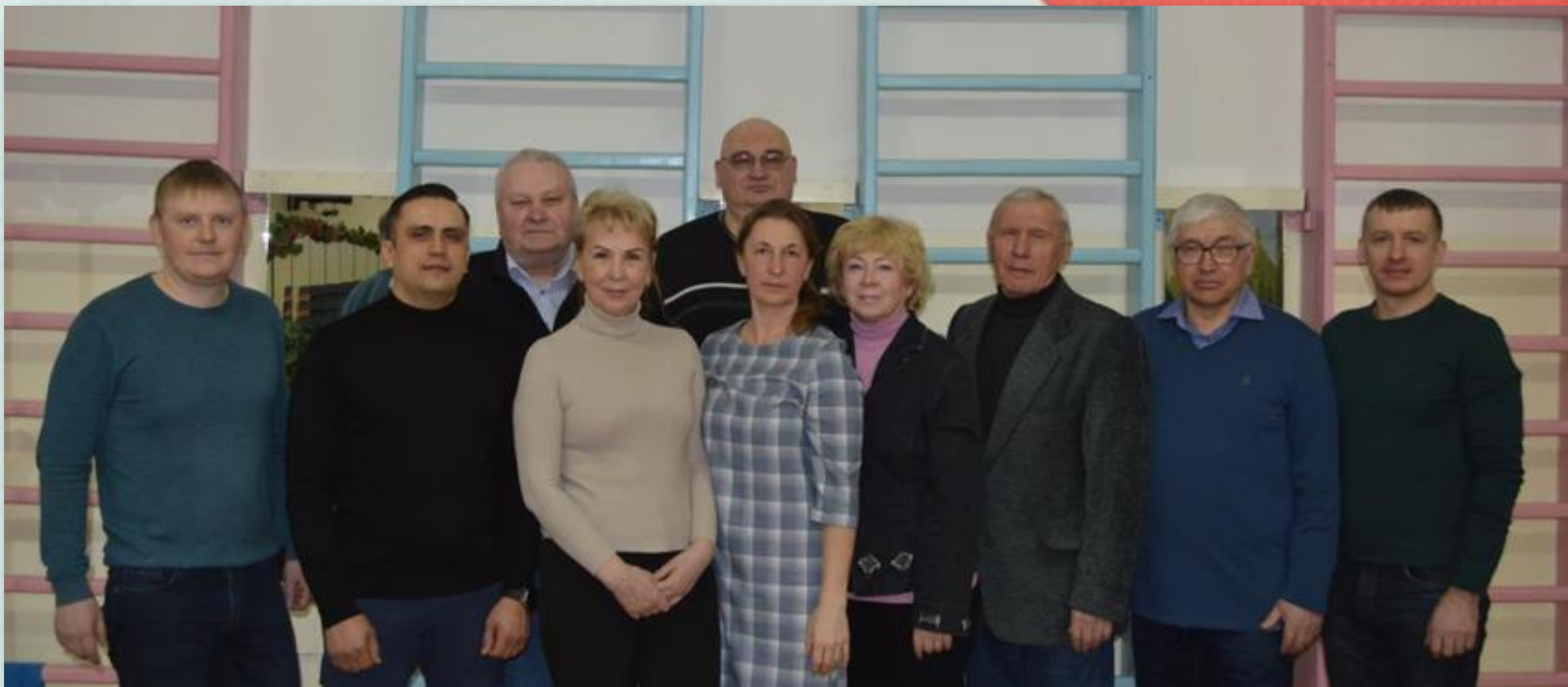
Профессорско-преподавательский состав кафедры физической культуры КемГМУ. 2022 год.