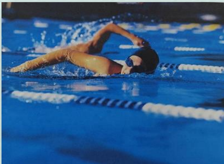
Мастер спорта СССР Майя Двуреченская