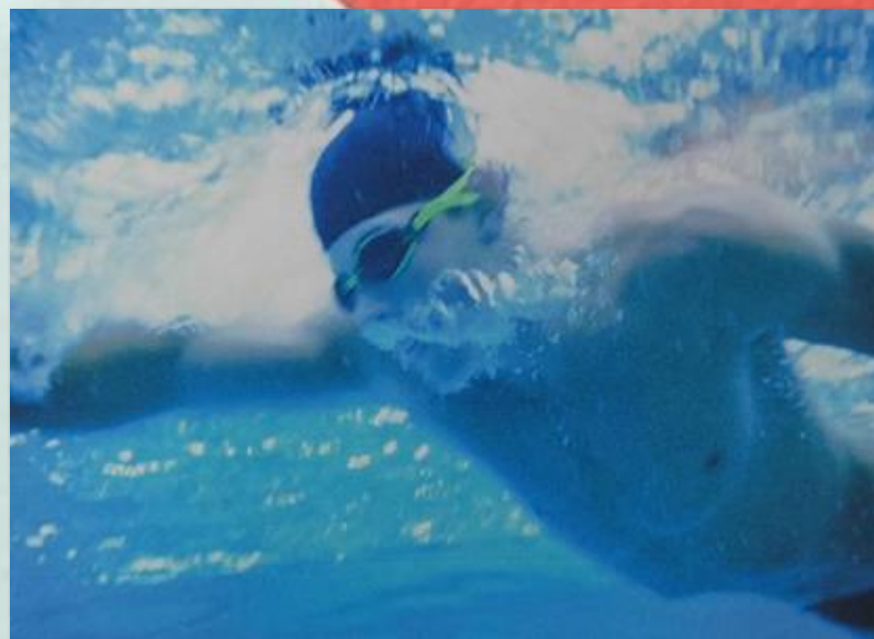
Мастер спорта СССР Евгений Косяненко на дистанции.